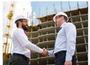
So kommt man zu Großaufträgen