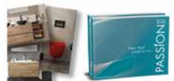
PASSION 2024/25 Katalog: Produkte, die Konsumenten begeistern

PASSION bringt sich dem neuen 112-Seiten starken Katalog Edition im Bereich-Geschäft. Passions24 ist unsere diesem Namen entsprechende Produkt- und Top-Neustellungen in einem exklusiven Zusammen.