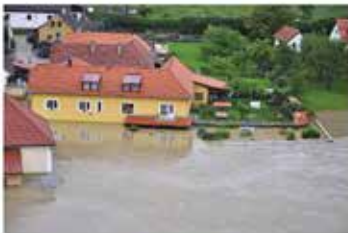
Hochwasser: Alle Fakten für Installateure