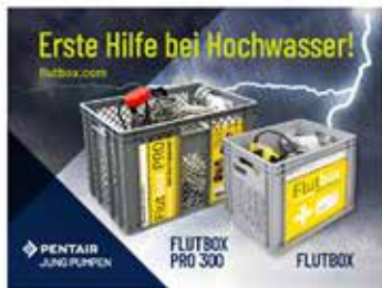
FLUTBOX: das Erste-Hilfe-Set bei Hochwasser

Komplettes Bestehend aus Tauchkorb, Tauchpumpe und Tauchschlauch zur Beseitigung von Wasser aus Gebäuden, Untergeschossen und Tiefparagen (Inhaltsverzeichnis: FLUTBOX PRO 300)