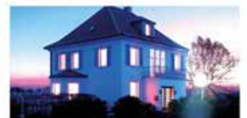
Mehr Komfort, weniger Kosten – mit Lösungen von Uponor